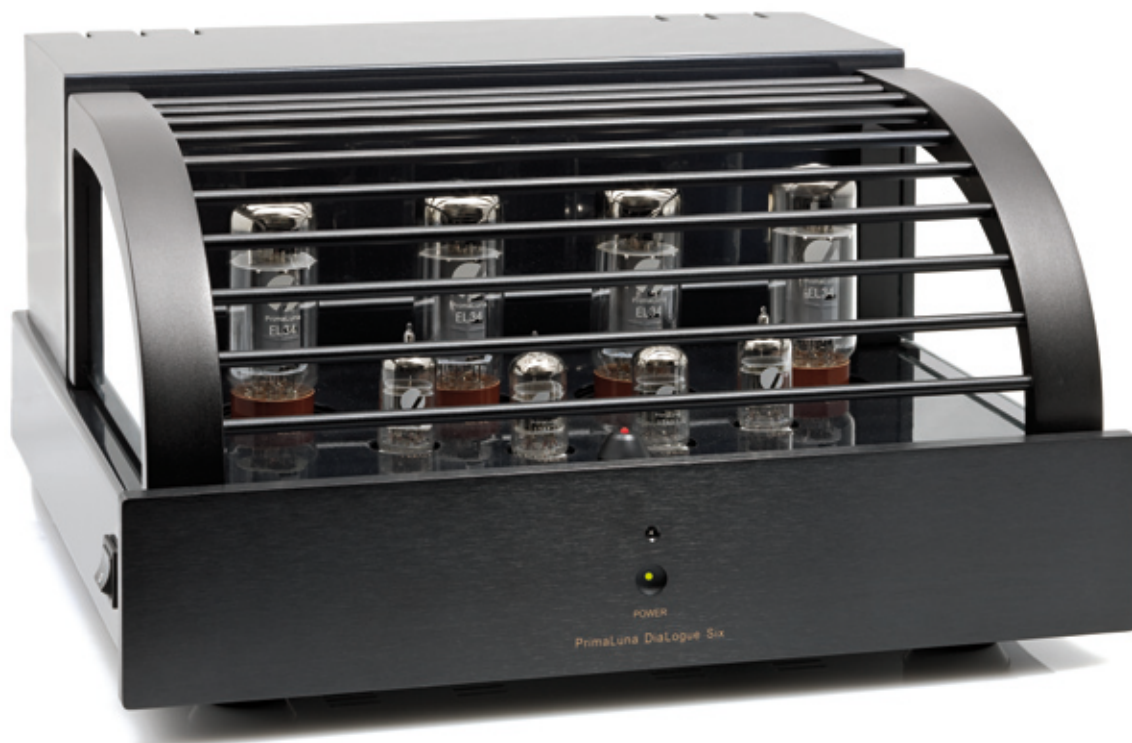
Er is ook een EL34 versie: PrimaLuna DiaLogue 'Six'

afdrank. Als je van wijn houdt, zoals ik, drink je waarschijnlijk ook niet iedere dag hetzelfde. Het hangt af van je humeur, de sfeer, het gerecht waar de wijn bij gedronken wordt en nog een aantal andere factoren. Het belangrijkste criterium bij de keuze tussen ultralinear en triode is, zoals ze bij PrimaLuna terecht zeggen, de persoonlijke voorkeur van de luisteraar, beïnvloed door de luidsprekers en de opname. Het heerlijke van deze versterkers is dat je twee fantastische wijnen in één verpakking hebt en naar believen kunt schakelen.