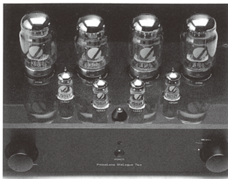
フロントの天面にあるインジケータで、三極管とウルトラリアの切り替え状況が分かる。

「プリマルーナ」は代表的なアンプ・メーカーに成長した。価値は群を抜いており、性能、出来、スタイル（特に真空管覆い部）は一級品の仕上がりである。それに加え、出力管交換に興味を示すオーディオ愛好家を虜にするだろう。大人が理解できる「プリマルーナ」は完成度、透明度、本物の持つ特性などで評価できる。すばらしい！